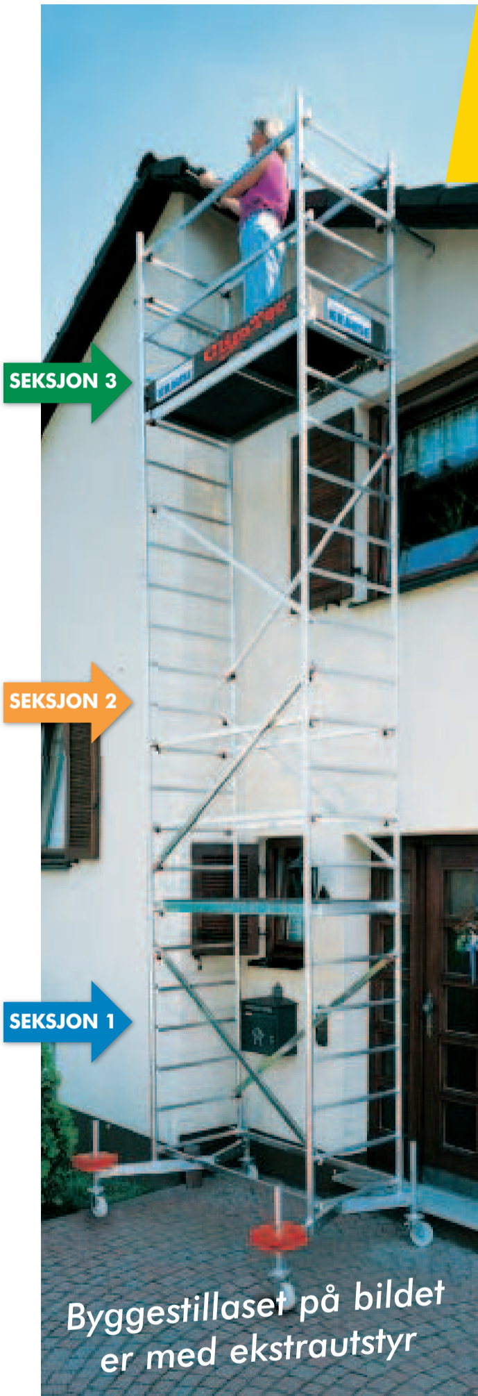
Byggestillaset på bildet er med ekstra utstyr