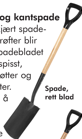
Spade, rett blad

• Fiskars veldig robuste prisvennlige tradisjonelle redskap uten farge og derfor skaller de ikke maling.